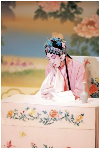
Fig. 13