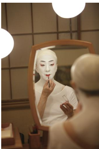
Fig. 5