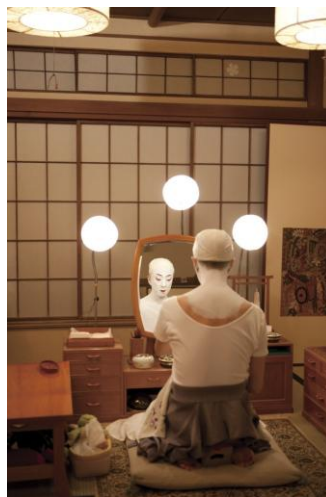
Fig. 4 ©Takashi Okamoto