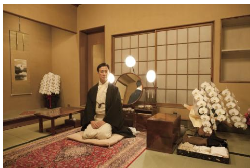
Fig. 11 ©Takashi Okamoto