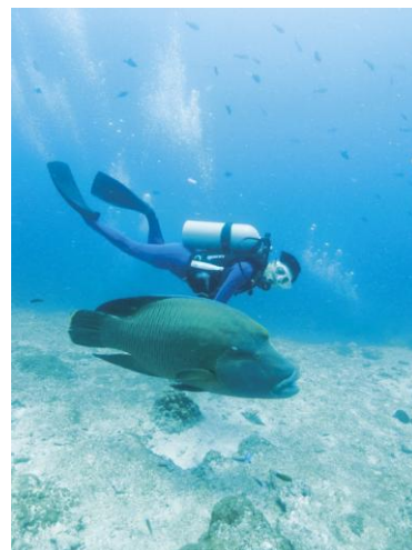
Fig. 16 ©Takashi Okamoto