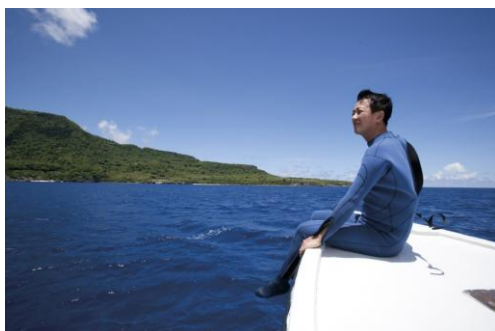
Fig. 15 ©Takashi Okamoto