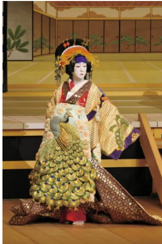
Fig. 9 ©Takashi Okamoto