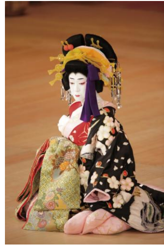
Fig. 8