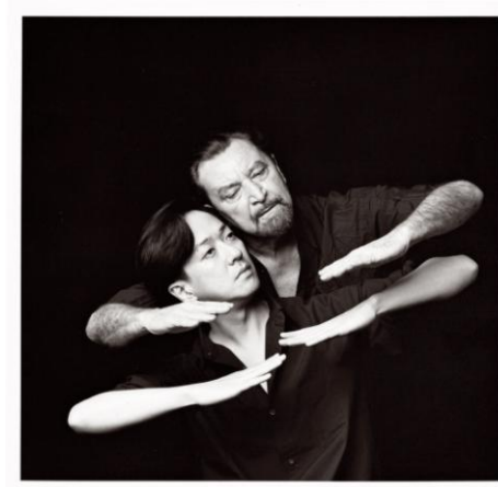
Fig. 14 ©Kishin Shinoyama