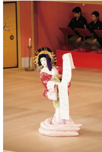
Fig. 10